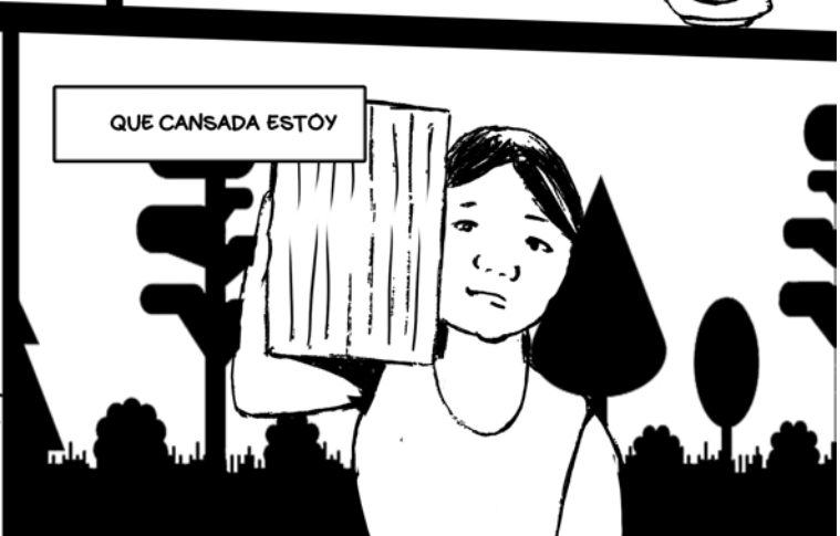
QUE CANSADA ESTOY