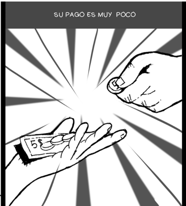
SU PAGO ES MUY POCO