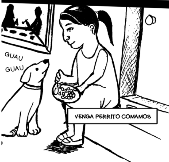
VENGA PERRITO COMAMOS